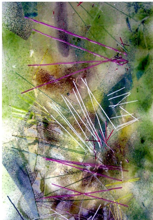
Porta dei fiori - vetrofusione dim. 800x500 mm

In studio si tengono corsi di Vetrofusione, Scultura figurativa, Ceramica Raku, Ceramica rinascimentale e tecniche ceramiche.