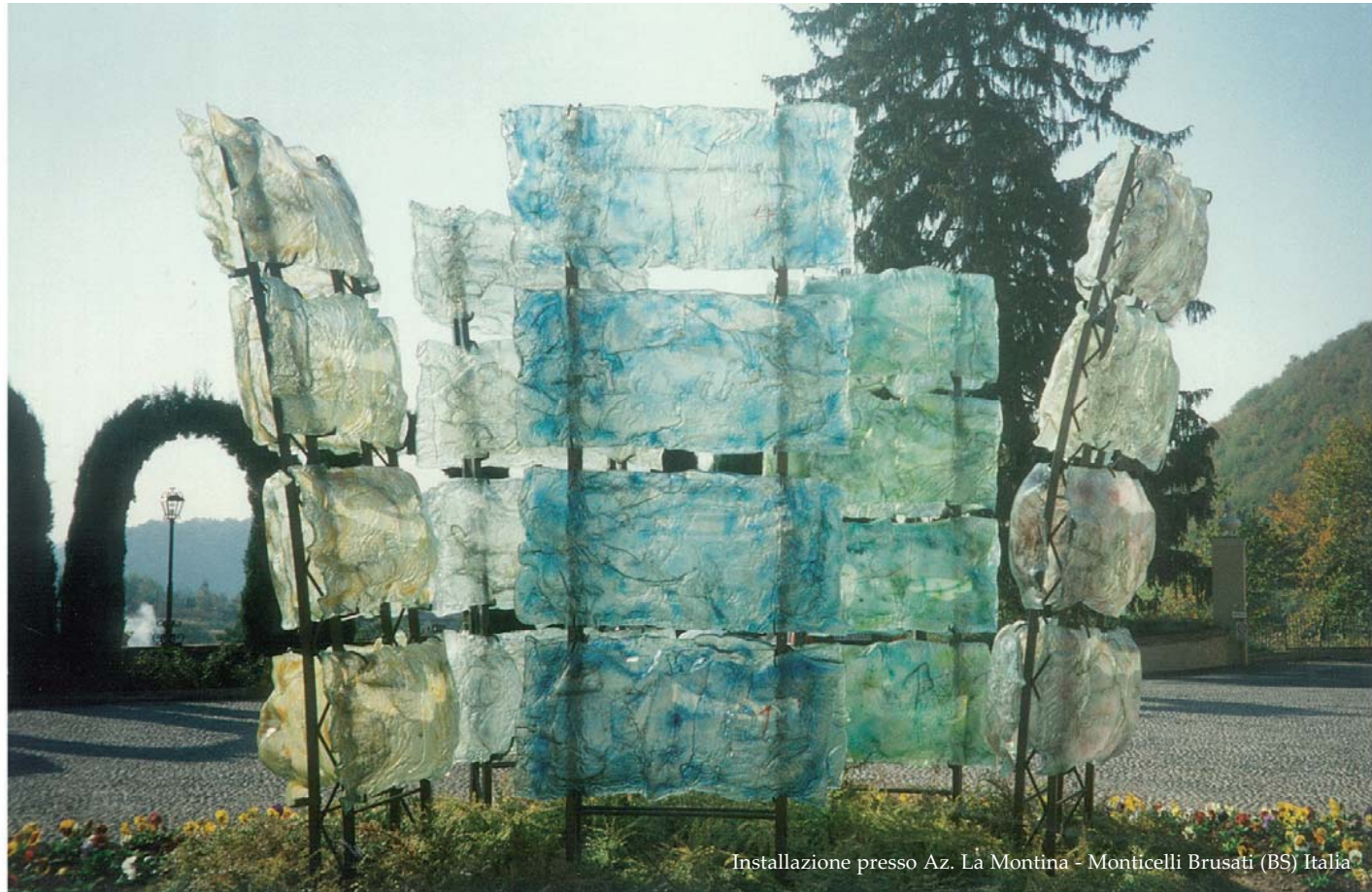
Installazione presso Az. La Montina - Monticelli Brusati (BS) Italia