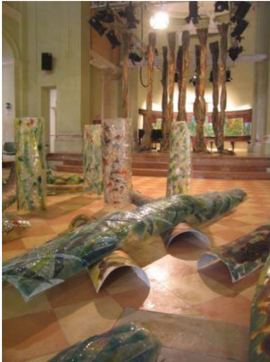
Particolare dell'Installazione " Alle porte della foresta "

Die in Bergamo geborene Bildhauerin und Malerin lebt und arbeitet in Brescia. Nach Abschluss einer pädagogischen Schule besucht sie die Kunstakademie in Venedig. In Faenza absolviert sie von 1986 bis 1988 Studienaufenthalte um die Raku-Bearbeitung bei Professor Galassi Mariani Cimati zu perfektionieren. Es folgt eine Zusammenarbeit mit dem Prähistorischen Museum nördlich von Mantua: Ausgrabungen und didaktische Katalogisierung seit 1990. Sie absolviert Volontariate über Glasfusion, deutsche Schule 1995. Gemeinsam mit den Schulen organisiert sie verschiedene didaktische Projekte. Für die Mitarbeiter des Museums hält sie Kurse für sehbehinderte und Blinde. Ihr persönlicher Forschungsschwerpunkt im Bereich der Bildhauerei beinhaltet: Terracotta, Bronze, Holz, Glasfaserkunststoff, Raku-Keramik und Glas. Mit diesen Materialien und Techniken beschäftigt sie sich auch heute.