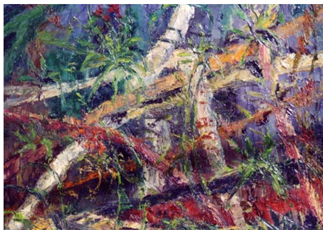
Foresta - olio su tela dim. 600x300 mm